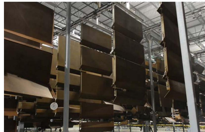
1) fig.1 - Barclays Center, Brooklyn, NY. Image courtesy @ Architectural Record http://archrecord.construction.com/projects/building_types_study/stadiums/2012/images/Barclays-Center-SHoP-main.jpg fig.2 - Weathering panel mass-customization factory. Image courtesy @ SHoP Architects http://www.shopdoes.com/wp-content/uploads/2011/06/Panels.jpg 2) fig.3 - URBAN GENETICS IN SAINT DENIS / EDUARDO ARROYO. Image courtesy @ ElCroquis